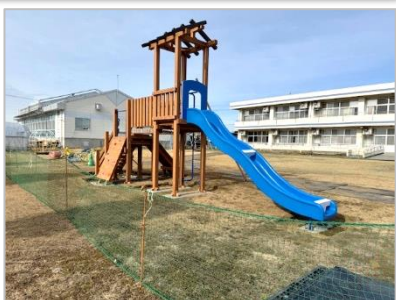
令和7年1月27日現在の写真です。新しい遊具が設置されました。この後、埋め戻し、整地、点検等の工事が行われます。

2月初旬に完成、その後点検等を行い、2月下旬頃から使用開始予定です。学校便り2月号で、改めて報告します。